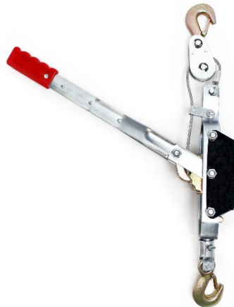
Imagen similar, puede diferir según el modelo

Por favor, lea y respete las instrucciones de uso e indicaciones de seguridad antes de la puesta en marcha.