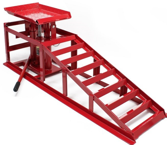
Immagine similare, può variare a seconda del modello

Prima della messa in funzione del dispositivo leggere e osservare le istruzioni per l'uso e le norme di sicurezza.