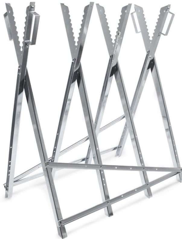
Immagine a scopo rappresentativo, può variare a seconda del modello

Prima di mettere in funzione il dispositivo, leggere e seguire le istruzioni per l'uso e le indicazioni di sicurezza.