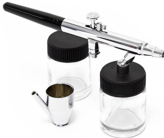
Imagen similar, puede diferir según el modelo

Por favor, lea y respete las instrucciones de uso e indicaciones de seguridad antes de la puesta en marcha.