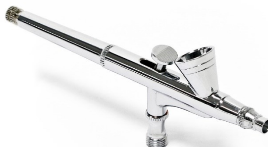
Imagen similar, puede diferir según el modelo

Por favor, lea y respete las instrucciones de uso e indicaciones de seguridad antes de la puesta en marcha.