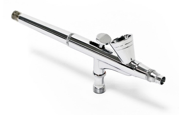
Illustration similaire, peut varier selon le modèle

Veillez lire et respecter le mode d'emploi et les consignes de sécurité avant la mise en service.