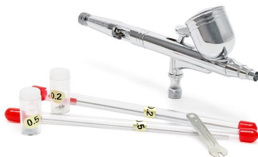
Imagen similar, puede diferir según el modelo

Por favor, lea y respete las instrucciones de uso e indicaciones de seguridad antes de la puesta en marcha.