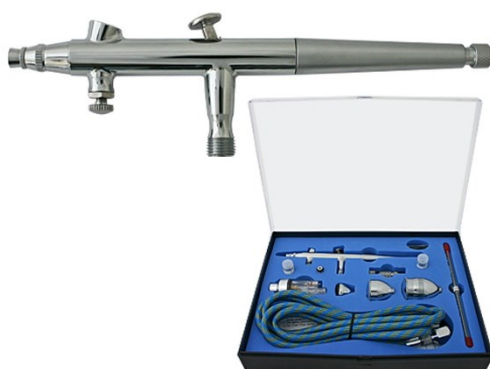
Imagen similar, puede diferir según el modelo

Por favor, lea y respete las instrucciones de uso e indicaciones de seguridad antes de la puesta en marcha.