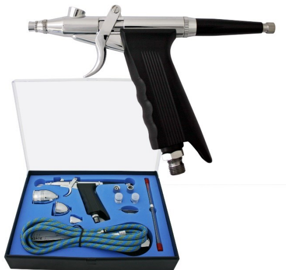
Illustration similaire, peut varier selon le modèle

Veillez lire et respecter le mode d'emploi et les consignes de sécurité avant la mise en service.