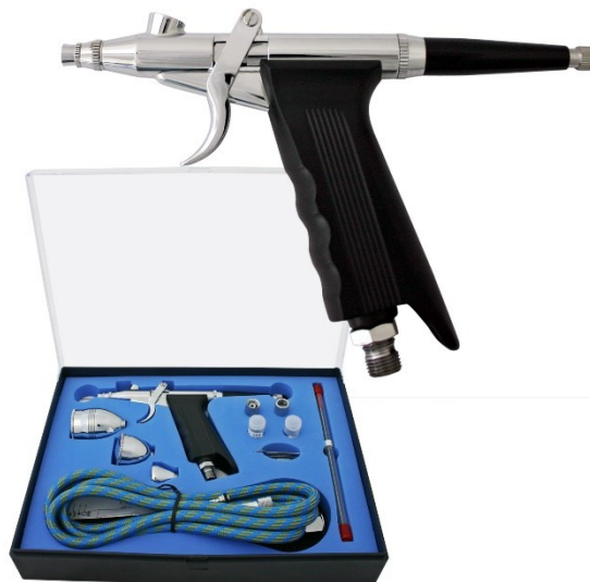
Immagine a scopo rappresentativo, può variare a seconda del modello

Prima di mettere in funzione il dispositivo, leggere e seguire le istruzioni per l'uso e le indicazioni di sicurezza.