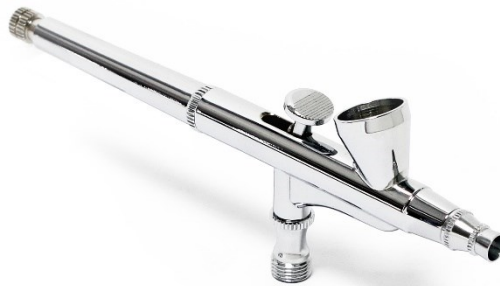
Immagine a scopo rappresentativo, può variare a seconda del modello

Prima di mettere in funzione il dispositivo, leggere e seguire le istruzioni per l'uso e le indicazioni di sicurezza.