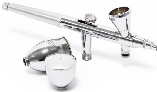
Imagen similar, puede diferir según el modelo

Por favor, lea y respete las instrucciones de uso e indicaciones de seguridad antes de la puesta en marcha.