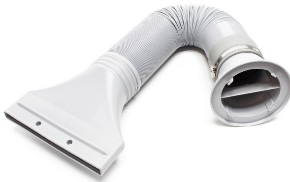
Imagen similar, puede diferir según el modelo

Por favor, lea y respete las instrucciones de uso e indicaciones de seguridad antes de la puesta en marcha.