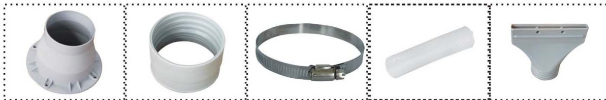
19. Conector de plástico