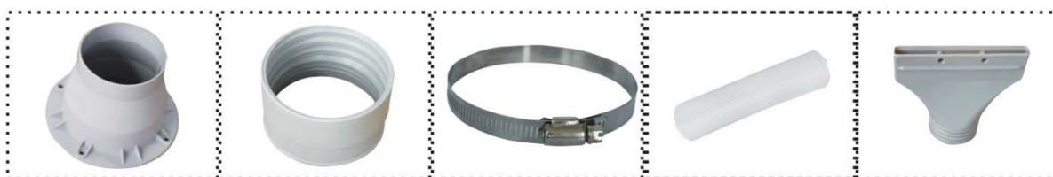
19. Manchon en plastique