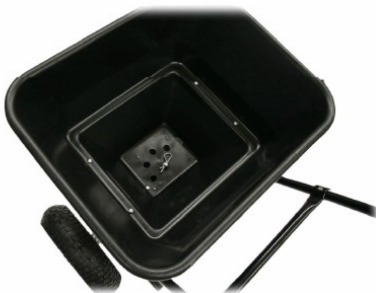
Abbildung der fertig montierten Wanne