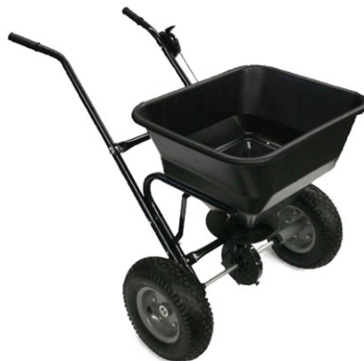
Immagine simile, può variare a seconda del modello

Prima della messa in funzione del dispositivo leggere e osservare le istruzioni per l'uso e le norme di sicurezza.