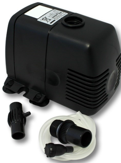
Illustration similaire, peut varier selon le modèle

Veuillez lire et respecter le mode d'emploi et les consignes de sécurité avant la mise en service.