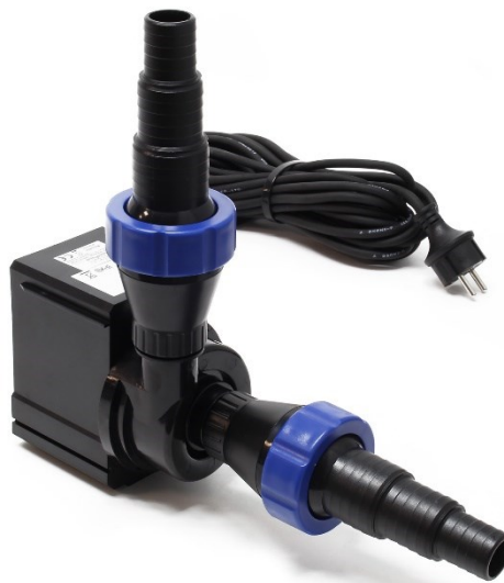
Illustration similaire, peut varier selon le modèle

Veillez lire et respecter le mode d'emploi et les consignes de sécurité avant la mise en service.