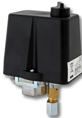
Immagine simile, può variare a seconda del modello

Prima della messa in funzione del dispositivo leggere e osservare le istruzioni per l'uso e le norme di sicurezza.