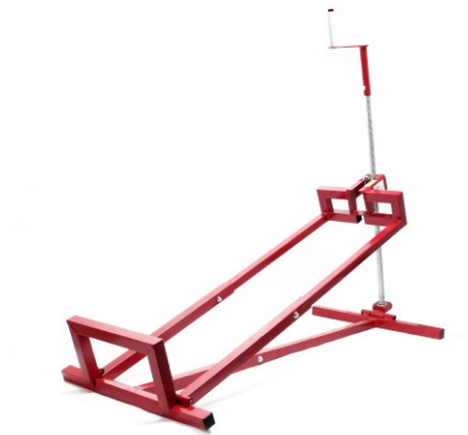
Immagine simile, può variare a seconda del modello

Prima della messa in funzione del dispositivo leggere e osservare le istruzioni per l'uso e le norme di sicurezza.