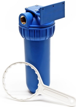
Immagine similare, può variare a seconda del modello

Prima della messa in funzione del dispositivo leggere e osservare le istruzioni per l'uso e le norme di sicurezza.