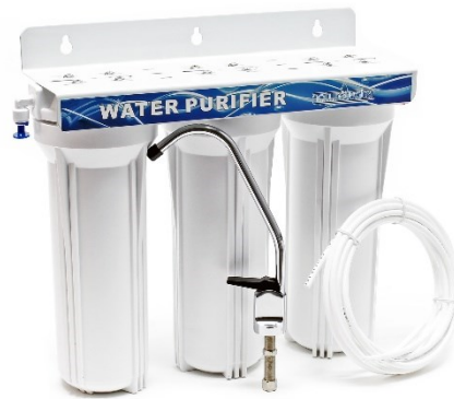
Illustration similaire, peut varier selon le modèle

Veillez lire et respecter le mode d'emploi et les consignes de sécurité avant la mise en service.