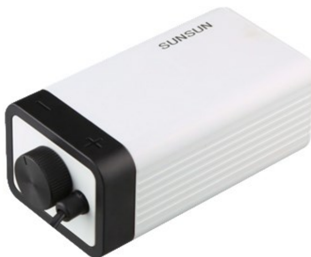
Immagine simile. Varia a seconda dei modelli

Prima di mettere in funzione il dispositivo, leggere attentamente le istruzioni.