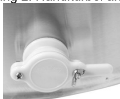
Abbildung 3: Verschluss des Honigablaufs anbringen (Ausführung modellabhängig)