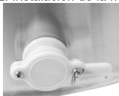
Figura 3: Instalación de la tapa de la salida de la miel (puede variar según el modelo)