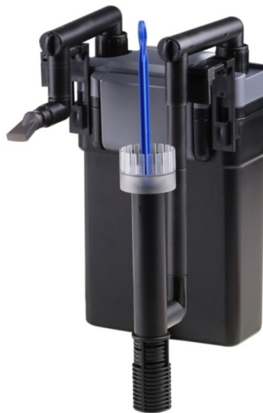
Immagine simile. Varia a seconda dei modelli

Prima di mettere in funzione il dispositivo, leggere attentamente le istruzioni.