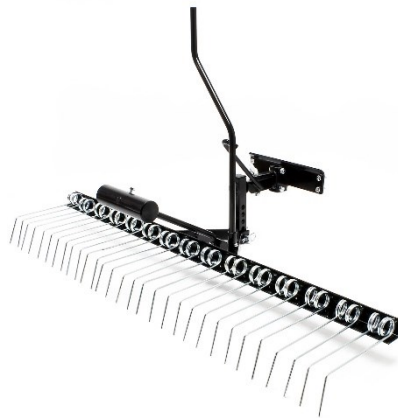
Immagine simile, può variare a seconda del modello

Prima della messa in funzione del dispositivo leggere e osservare le istruzioni per l'uso e le norme di sicurezza.