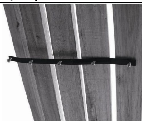
Passaggio 4 | viti C