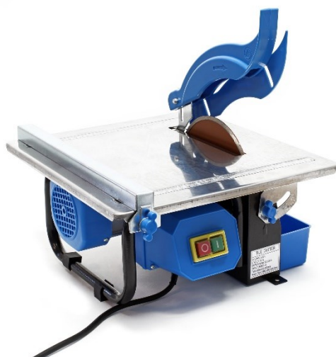
Imagen similar, puede diferir según el modelo

Por favor, lea y respete las instrucciones de uso e indicaciones de seguridad antes de la puesta en marcha.