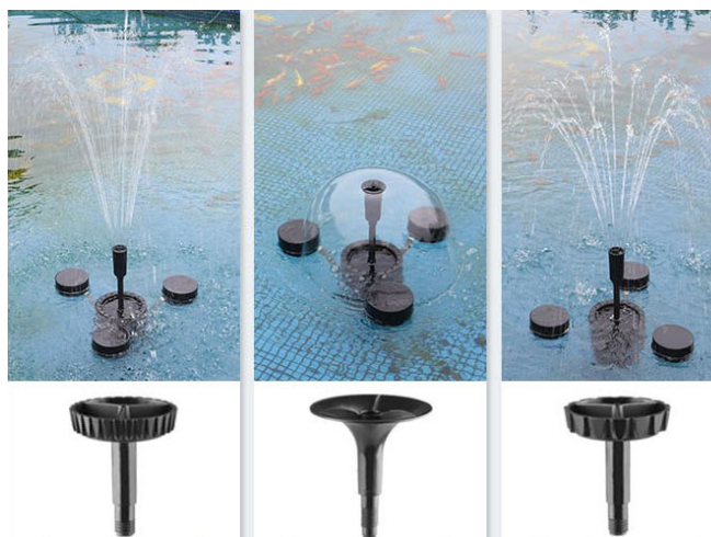
Mode d'opération comme fontaine