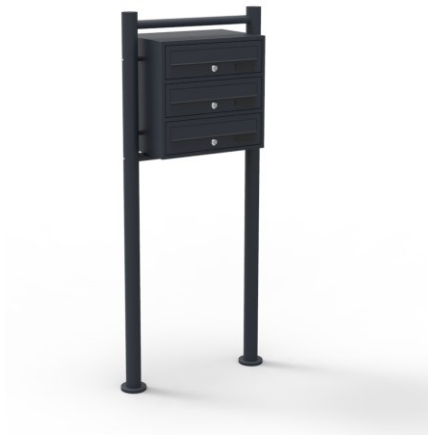
Immagine a scopo rappresentativo, può variare a seconda del modello

Prima di mettere in funzione il dispositivo, leggere e seguire le istruzioni per l'uso e le indicazioni di sicurezza.