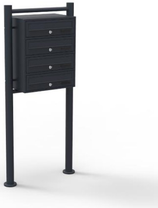
Immagine a scopo rappresentativo, può variare a seconda del modello

Prima di mettere in funzione il dispositivo, leggere e seguire le istruzioni per l'uso e le indicazioni di sicurezza.