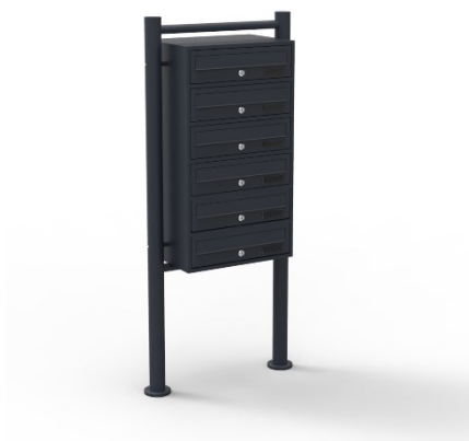
Imagen similar, puede diferir según el modelo

Por favor, lea y respete las instrucciones de uso e indicaciones de seguridad antes de la puesta en marcha.