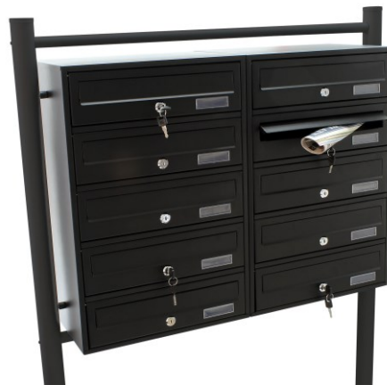
Immagine a scopo rappresentativo, può variare a seconda del modello

Prima di mettere in funzione il dispositivo, leggere e seguire le istruzioni per l'uso e le indicazioni di sicurezza.