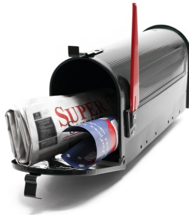
Immagine simile, può variare a seconda del modello

Prima della messa in funzione del dispositivo leggere e osservare le istruzioni per l'uso e le norme di sicurezza.