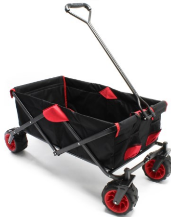
Immagine simile, può variare a seconda del modello

Prima della messa in funzione del dispositivo leggere e osservare le istruzioni per l'uso e le norme di sicurezza.