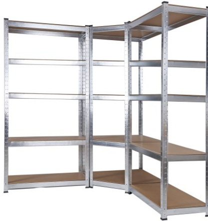
Immagine simile, può variare a seconda del modello

Prima della messa in funzione del dispositivo leggere e osservare le istruzioni per l'uso e le norme di sicurezza.