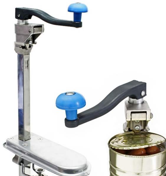
Afgebeeld product kan per model enigszins afwijken

Lees vóór ingebruikname de gebruiksaanwijzing en de veiligheidsvoorschriften en neem deze in acht.