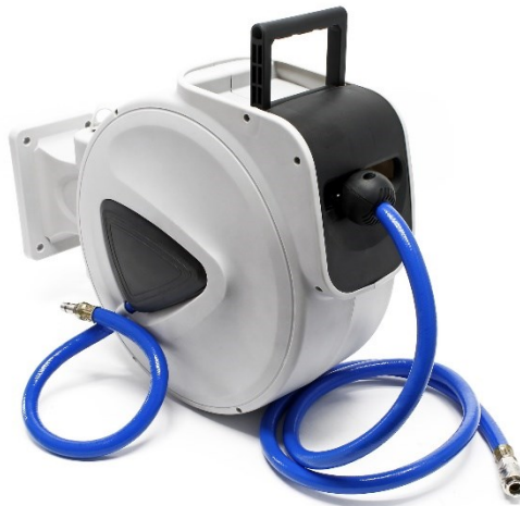
Immagine simile, può variare a seconda del modello

Prima della messa in funzione del dispositivo leggere e osservare le istruzioni per l'uso e le norme di sicurezza.