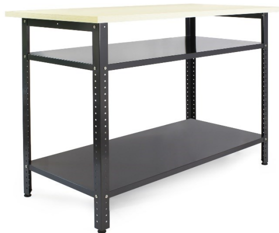
Immagine a scopo rappresentativo, può variare a seconda del modello

Prima di mettere in funzione il dispositivo, leggere e seguire le istruzioni per l'uso e le indicazioni di sicurezza.