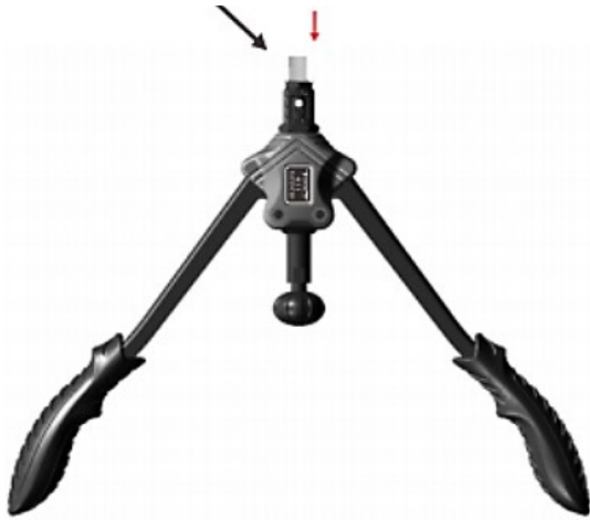
1 re étape

Ouvrez la poignée et placez l'écrou à sertir sur l'embout.