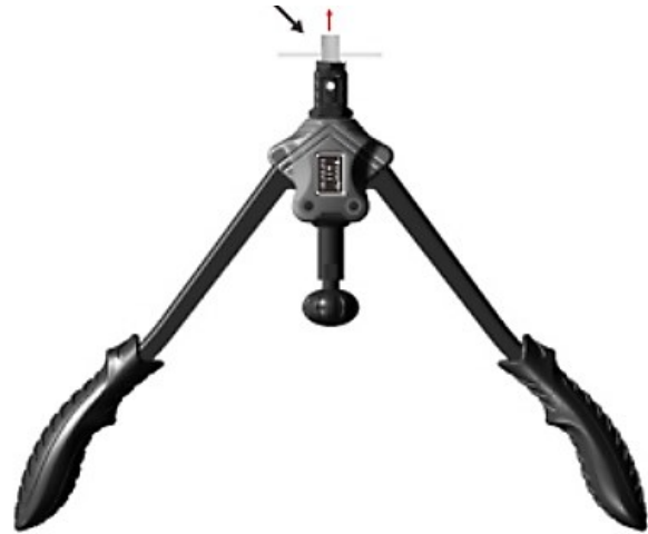
2 e étape

Ouvrez la poignée et placez l'écrou à sertir sur l'embout.