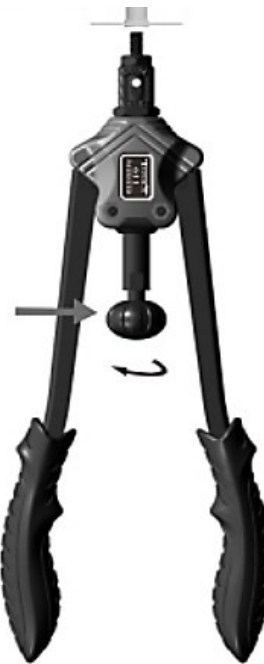
4 e étape

Serrez les leviers de la poignée pour fixer l'écrou à sertir.