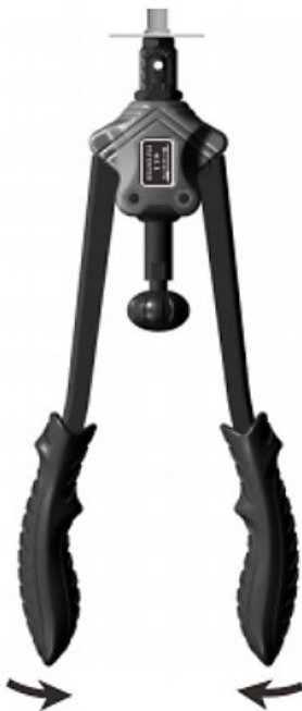
3 e étape

Faites glisser la tige qui tient l'écrou à sertir dans le trou dans lequel l'écrou doit être placé.