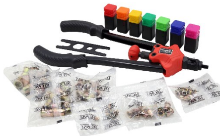
Immagine a scopo rappresentativo, può variare a seconda del modello

Prima di mettere in funzione il dispositivo, leggere e seguire le istruzioni per l'uso e le indicazioni di sicurezza.