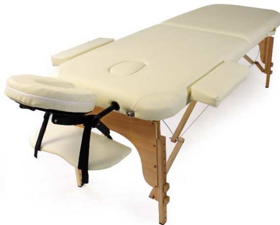
Illustration similaire, peut varier selon le modèle

Veillez lire et respecter le mode d'emploi et les consignes de sécurité avant la mise en service.