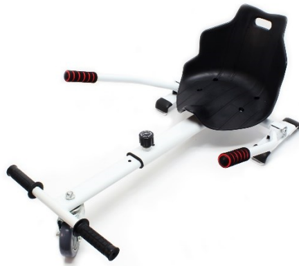
Immagine simile, può variare a seconda del modello

Prima della messa in funzione del dispositivo leggere e osservare le istruzioni per l'uso e le norme di sicurezza.