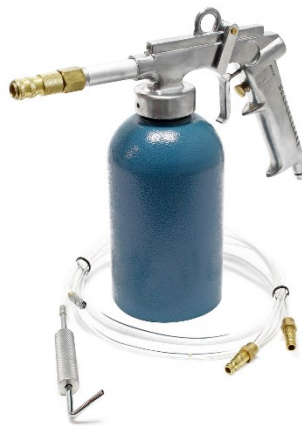
Illustration similaire, peut varier selon le modèle

Veillez lire et respecter le mode d'emploi et les consignes de sécurité avant la mise en service.