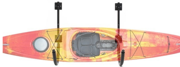
Immagine similare, può variare a seconda del modello

Prima della messa in funzione del dispositivo leggere e osservare le istruzioni per l'uso e le norme di sicurezza.