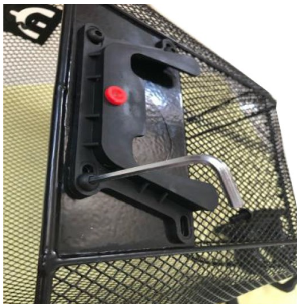
5. Befestigen Sie die beiden Teile mit Hilfe der Schrauben.