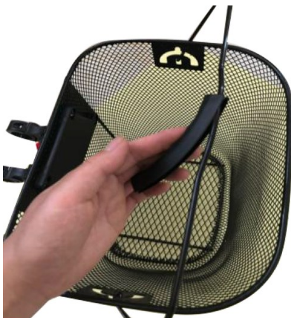
7. Befestigen Sie die den Kunststoffgriff am Henkel.