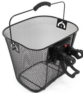
Imagen similar, puede diferir según el modelo

Por favor, lea y respete las instrucciones de uso e indicaciones de seguridad antes de la puesta en marcha.