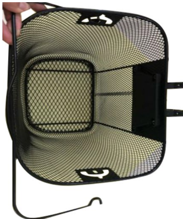
6. Fixez la poignée au panier en insérant ses extrémités dans les trous prévus à cet effet.