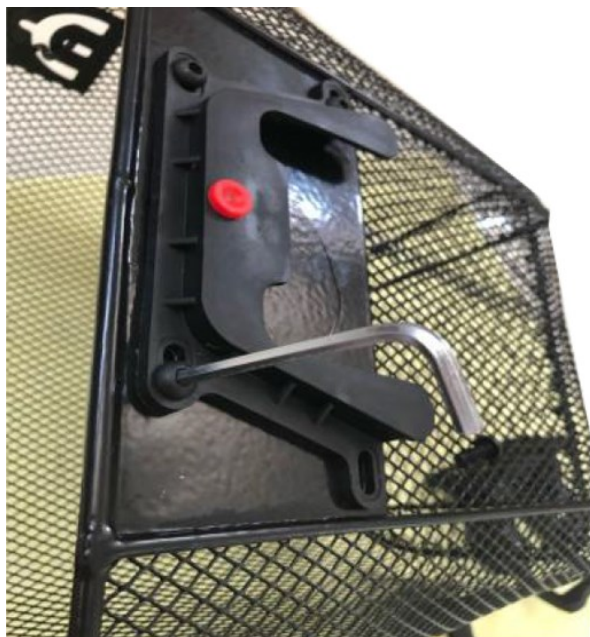
5. Bevestig beide basisplaten met behulp van de meegeleverde schroeven.