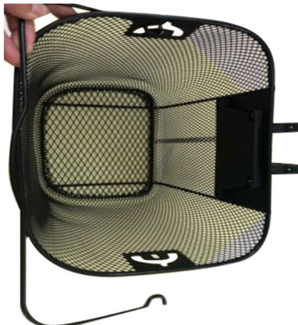
6. Breng de draaghendel van de mand aan door de uiteinden ervan in de daarvoor bestemde gaten vast te zetten.